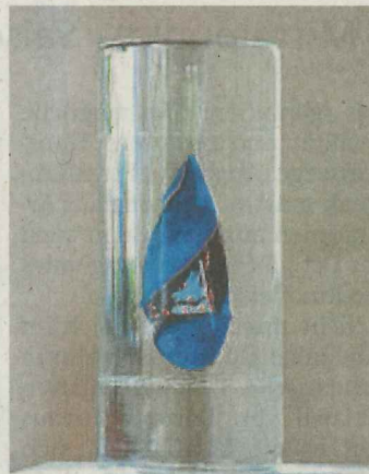
Wolfgang Mussnug schafft Glasskulpturen.